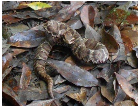
ニホンマムシ（城山：吉田博之）