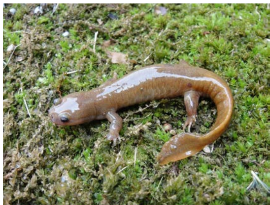
カスミサンショウウオ（石丸）