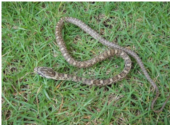
アオダイショウ幼体（ひかりヶ丘）