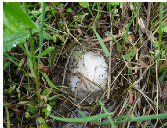
シュレーゲルアオガエル卵塊（吉留）