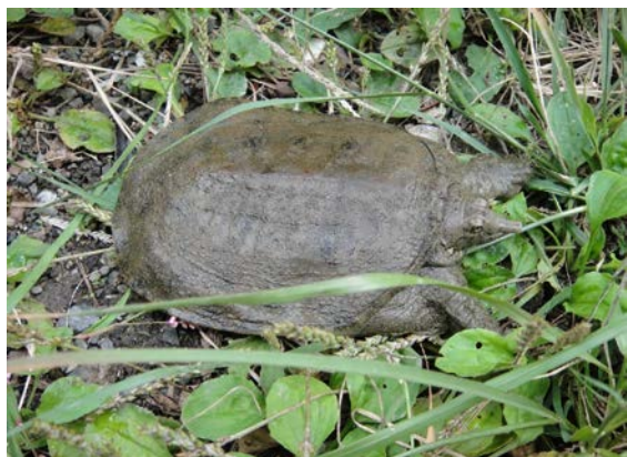
ニホンスッポン（稲元）