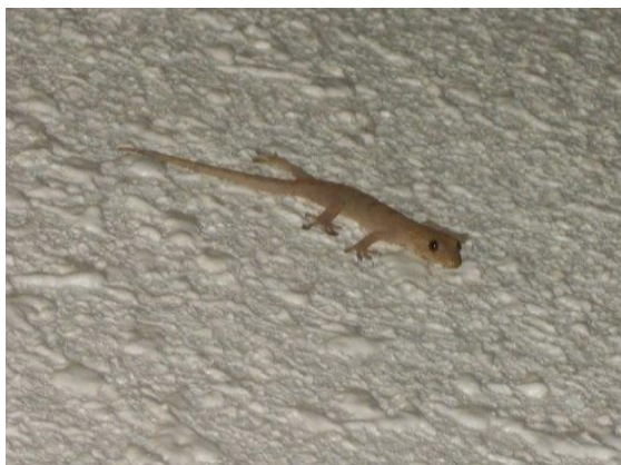
ニホンヤモリ（日の里：吉田博之）