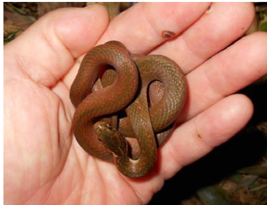
ヒバカリ（許斐山：吉田博之）