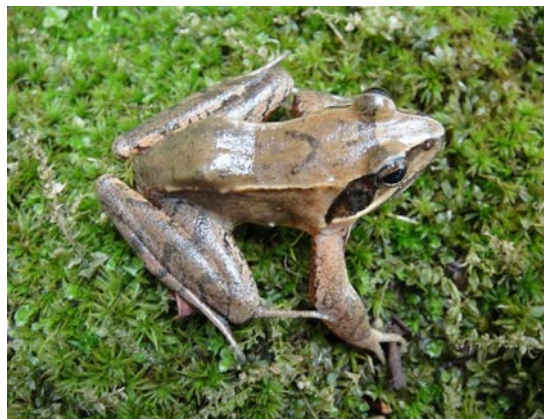
ニホンアカガエル (用山)