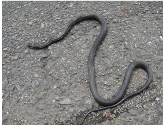
シマヘビ黒化型（野坂）