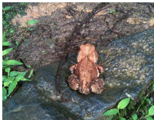
ニホンヒキガエル (新立山：吉田博之)