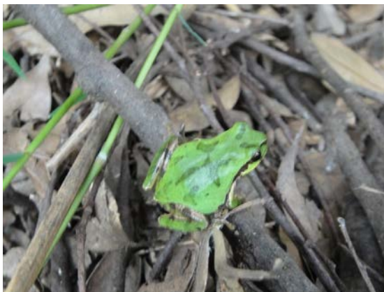
ニホンアマガエル (吉田)