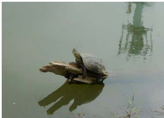
クサガメ（田久：吉田博之）