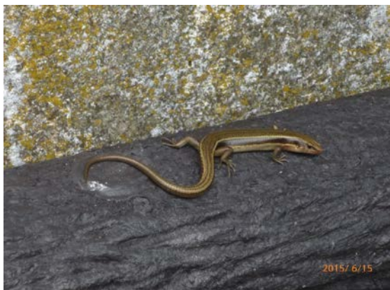
ニホントカゲ（沖ノ島）