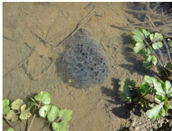
ニホンアカガエル卵塊 (吉留)