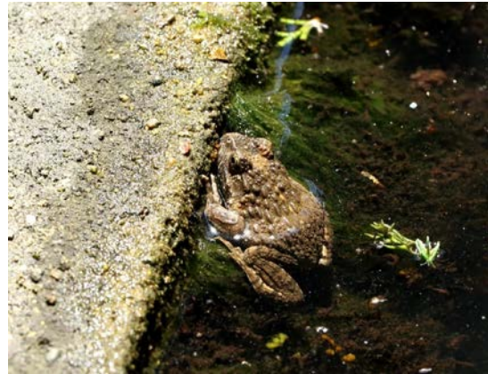
ツチガエル（王丸：岩元順二）