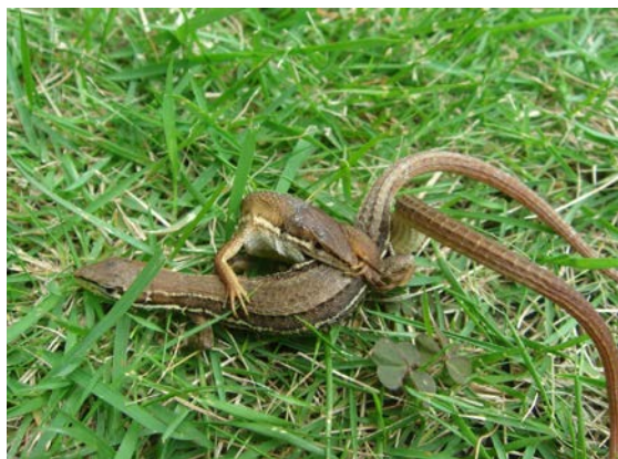
ニホンカナヘビ（ひかりヶ丘）