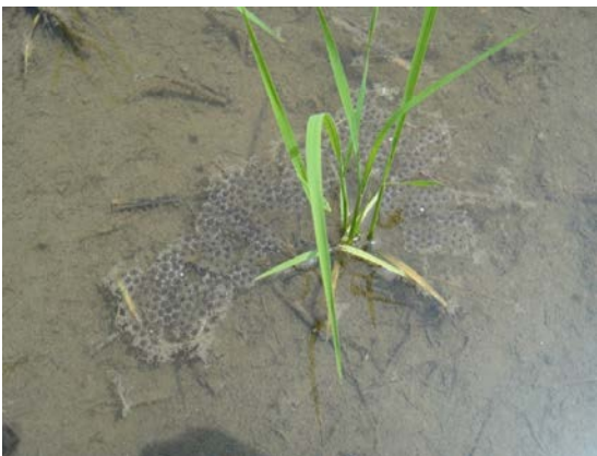
ヌマガエル卵塊（村山田）