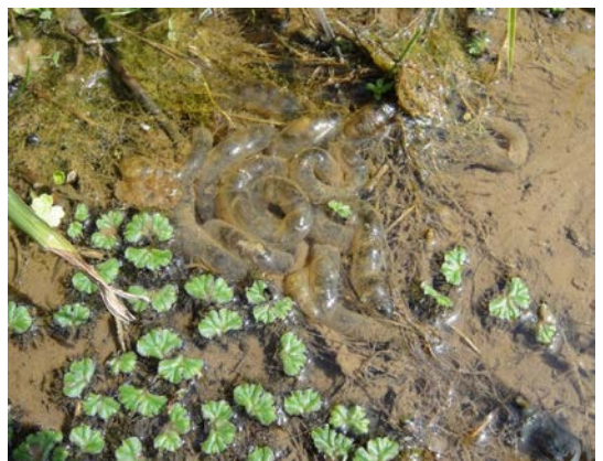
カスミサンショウウオ卵塊（大島）