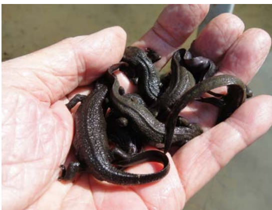
アカハライモリ (用山)