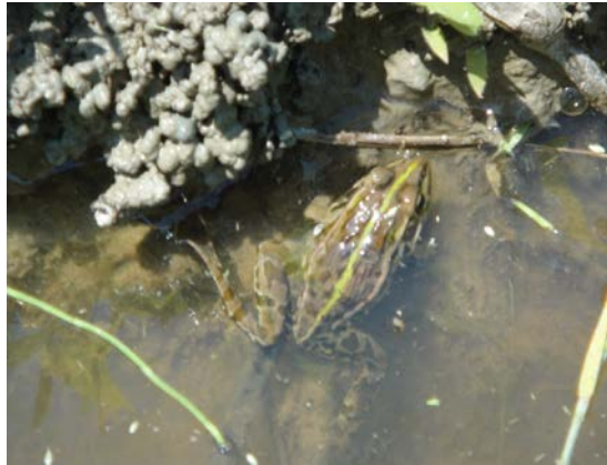
トノサマガエル幼体（朝町）