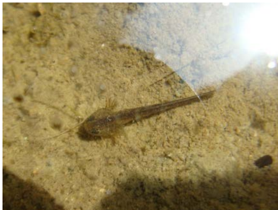
カスミサンショウウオ幼生 (三郎丸：黒川康子)