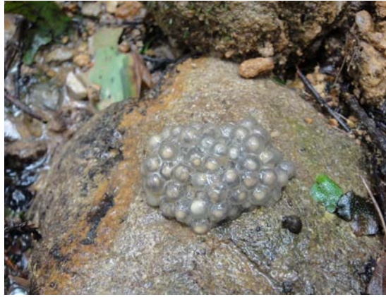
タゴガエル卵塊（野坂）