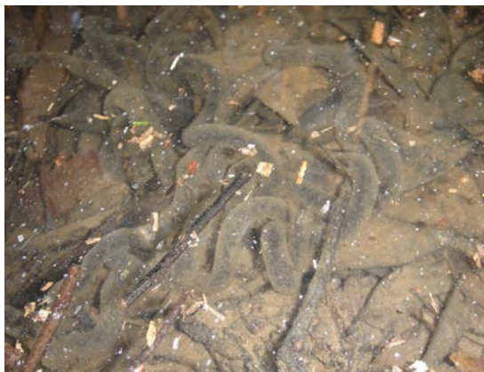
ニホンヒキガエル卵塊 (池浦)