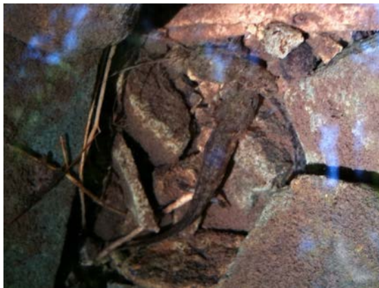
ブチサンショウウオ幼生 (孔大寺山：吉田博之)